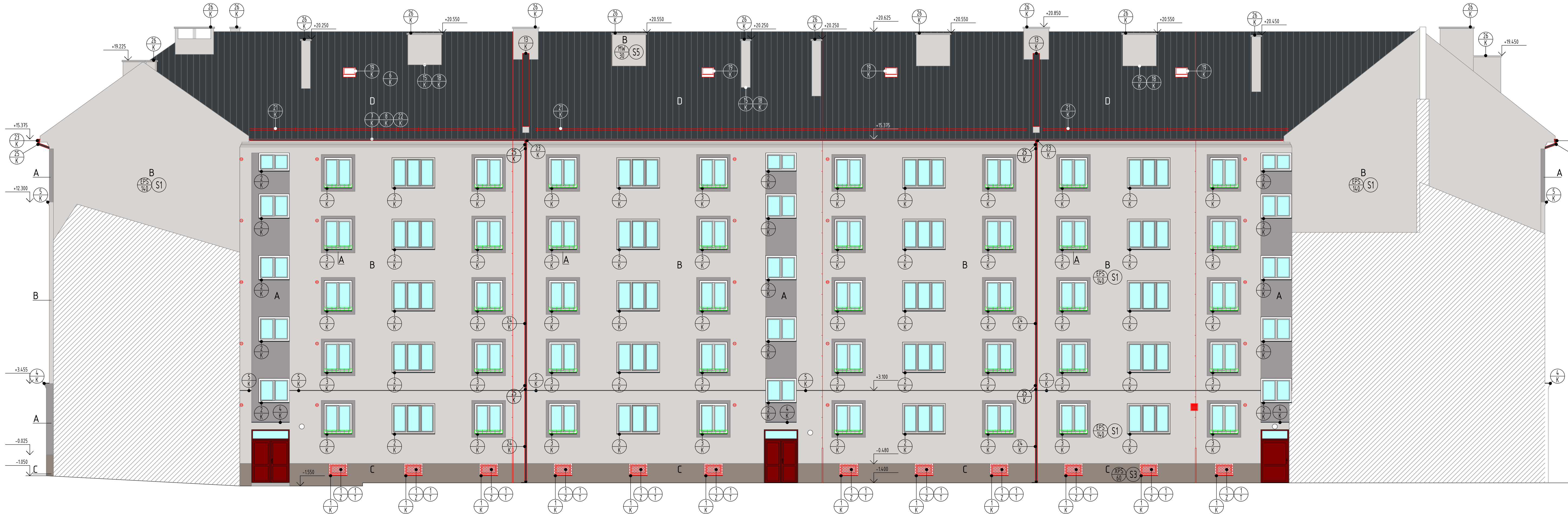
POHLED BOČNÍ ZE DVORA